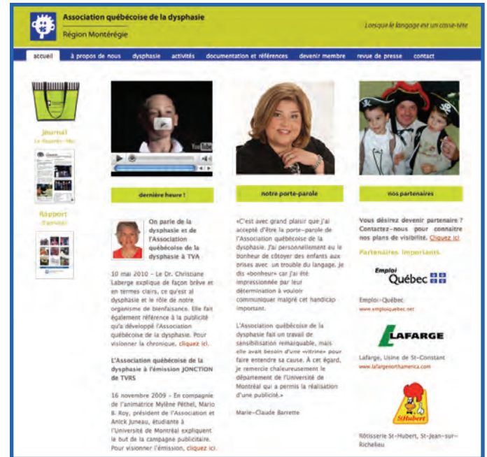
Information à la page 2

Quant au lapin en chocolat, il vient d'une vieille tradition populaire qui dit qu'à Pâques, c'est au tour des lapins de couvrir les oeufs ! Drôle d'idée non ?